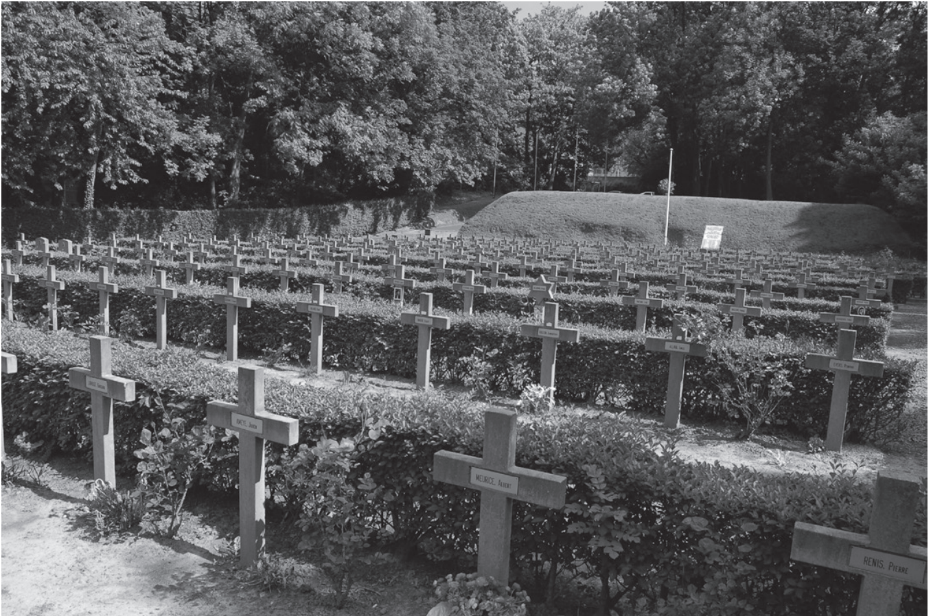
Ereperk der Gefusilleeren in Schaarbeek

brengt men mevrouw Collet naar het militair ziekenhuis in de Kroonlaan (Avenue de la Couronne) waar de beenwonde opgelopen bij haar arrestatie kan worden verzorgd. De ondervragingen grijpen deels in de gevangenis zelf, deels in de Kommandantur aan de Wetstraat (Rue de la Loi) 1 plaats, in de tot rechtszaal omgebouwde grote zaal van de Senaat. Regeringscommissaris en krijgsauditeur Stöber, niet vies van enige theatraliteit, leidt de ondervragingen. Op 2 maart begint het eigenlijke proces waarbij Gabriëlle de doodstraf krijgt en mevrouw Collet tot 15 jaar dwangarbeid wordt veroordeeld. Gabriëlle stelt alles in het werk om de rechters te doen inzien wat ze die oude mevrouw, die volgens haar overigens helemaal niet medeplichtig is, aandoen. 's Anderendaags wordt Gabriëlles vonnis bekrachtigd, maar mevrouw Collet zal worden vrijgelaten “zodra men het zegt”. Dat duurt nog tot eind april. In de regel werden terdoodveroordeelden geëxecuteerd de nacht volgend op de veroordeling. Bij Gabriëlle duurt de onzekerheid