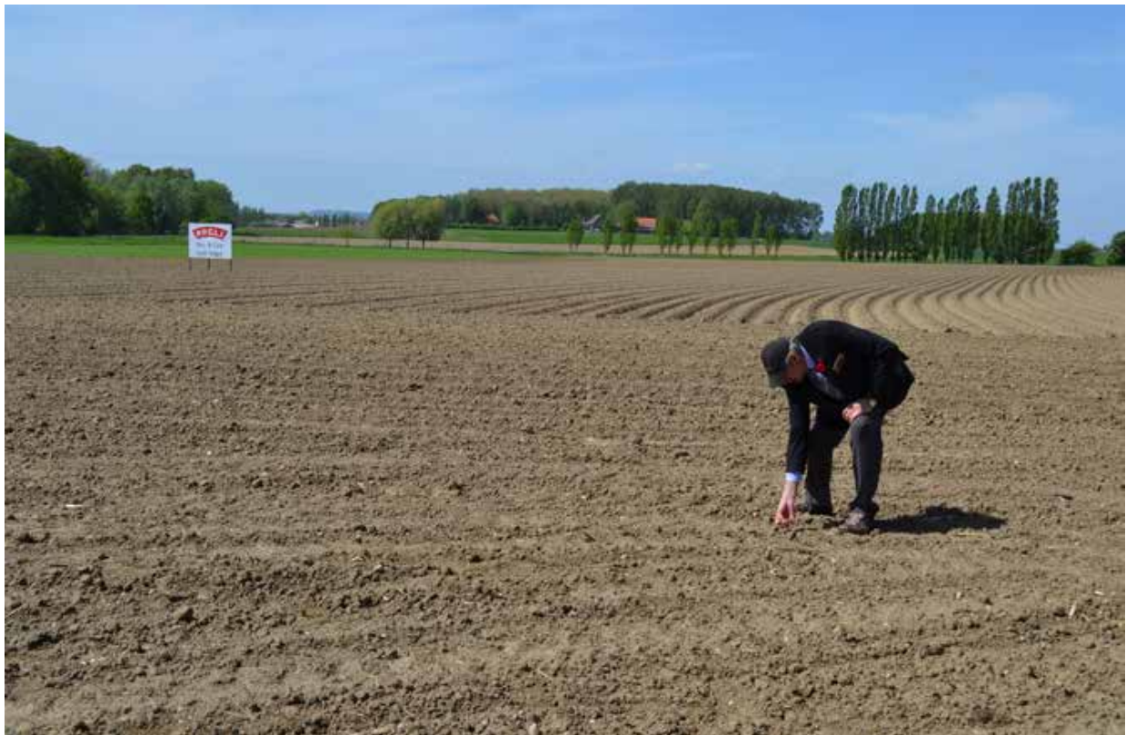
some corner of a foreign field / That is for ever ... Canada (naar Rupert Brooke, The Soldier)