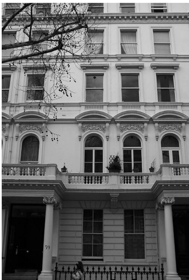
Queen's Gate 39