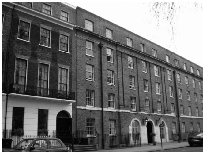
Mecklenburgh Square 41

De ergernis aan Walter Turners handelwijze bleef toenemen en Tufton Street leek Siegfried een aflopende zaak. Op 25 augustus 1925 namen Philip en Ottoline Morrell hem mee om enkele kamers aan Mecklenburgh Square te bekijken. Nummer 21 vond hij te groot en te duur. Nummer 41 leek wel geschikt maar hij kon de kamers op de begane grond pas de volgende dag bezoeken. De zitkamer alleen al was dubbel zo groot als zijn beide vertrekken in Tufton Street samen. Hij nam een optie. Het was “ met de grootst mogelijke opluchting ” dat hij op 31 augustus met de auto vertrok (“ ontsnapte ”) voor een verblijf bij zijn vrienden, de Heads, (Henry Head, neuroloog, en zijn vrouw Ruth) in hun buitenhuis in Lyme Regis. Bij die gelegenheid bezocht hij ook weer Thomas Hardy in Dorchester.