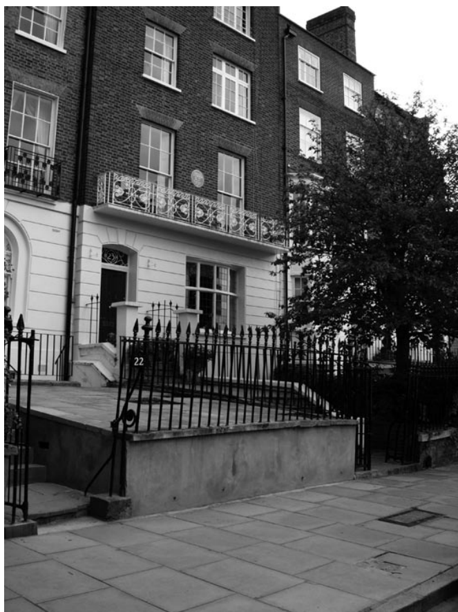
Campden Hill Square 23

Door het vele reizen met Stephen en het herhaalde verblijf in luxueuze hotels was Siegfried Campden Hill Square beu geworden en na hun terugkeer in Engeland in mei 1930, huurde hij kamers in het Hyde Park Hotel. Toch zou hij de volgende jaren de flat occasioneel nog gebruiken. Officieel verliet hij Campden Hill Square 23 pas in 1932, hoewel hij in november 1931 al een huurcontract had getekend voor Fitz House in Teffont Magna, een dorpje aan de zuidelijke rand van Salisbury Plain in Wiltshire. (F.R.)