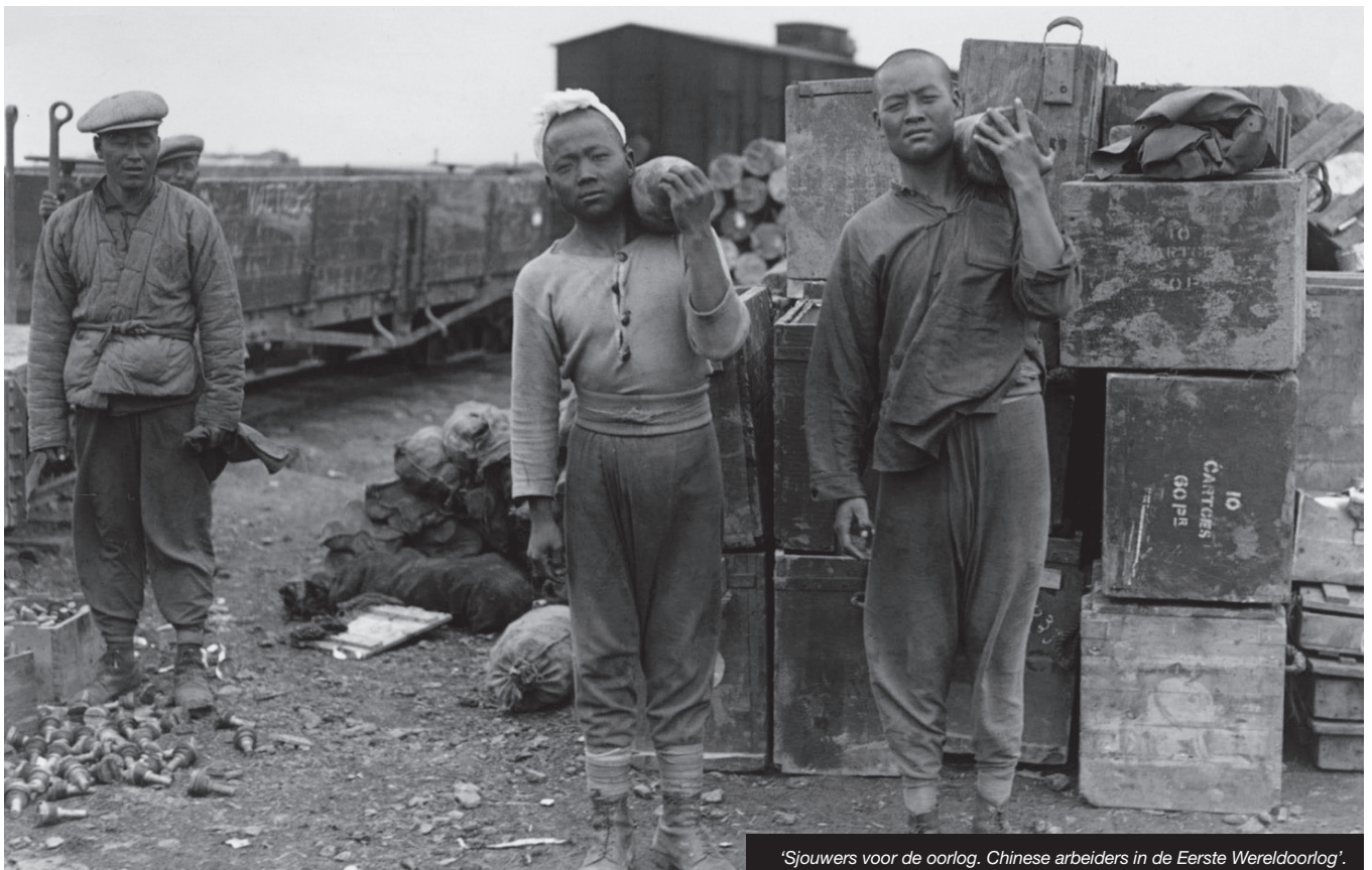
'Sjouwers voor de oorlog. Chinese arbeiders in de Eerste Wereldoorlog'.

IJzertoren, Diksmuide – www.ijzertoren.org