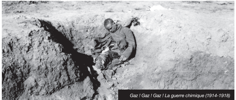
Gaz ! Gaz ! Gaz ! La guerre chimique (1914-1918)

Historial de la Grande Guerre, Péronne – www.historical.org