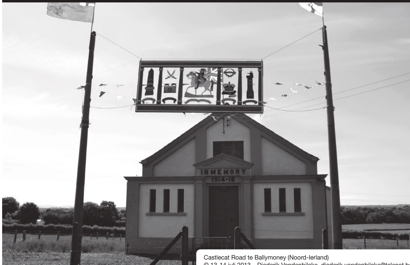
Castlecat Road te Ballymoney (Noord-Ierland)