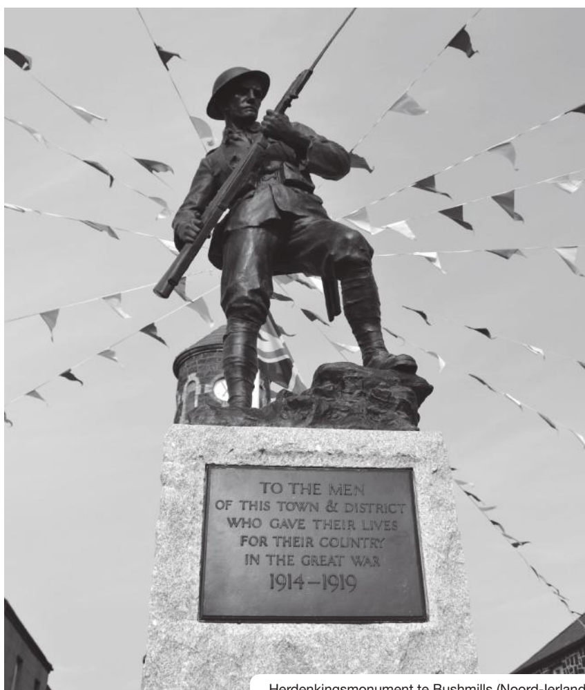
Herdenkingsmonument te Bushmills (Noord-Ierland)