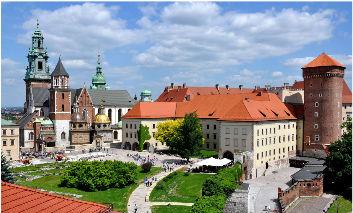
Wawel met kathedraal en koninklijk paleis

Op dag drie gaat het met de bus naar Tarnów waar we drie nachten verblijven. en van waaruit we diverse busritten en bezoeken brengen in Malopolska (Klein-Polen), een historische regio in het zuiden en zuidoosten van Polen. De regio is rijk aan historische monumenten, kastelen, natuurschoon en UNESCO-werelderfgoed. Malopolska is het Poolse deel van de regio Galicia uit het voormalige Habsburgse Rijk. In 1914, 1915 en 1916 werd hier hevig gevochten. Talrijke prachtige Oostenrijks-Hongaarse begraafplaatsen getuigen ervan tot op deze dag.